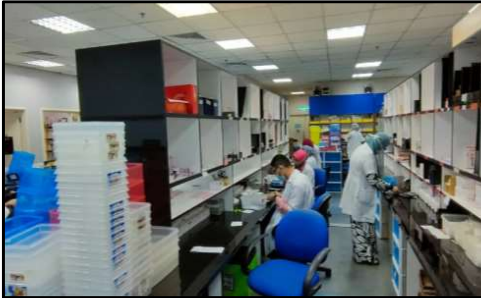
Ruang Penyediaan Ubat