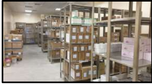
Stor penyimpanan ubat