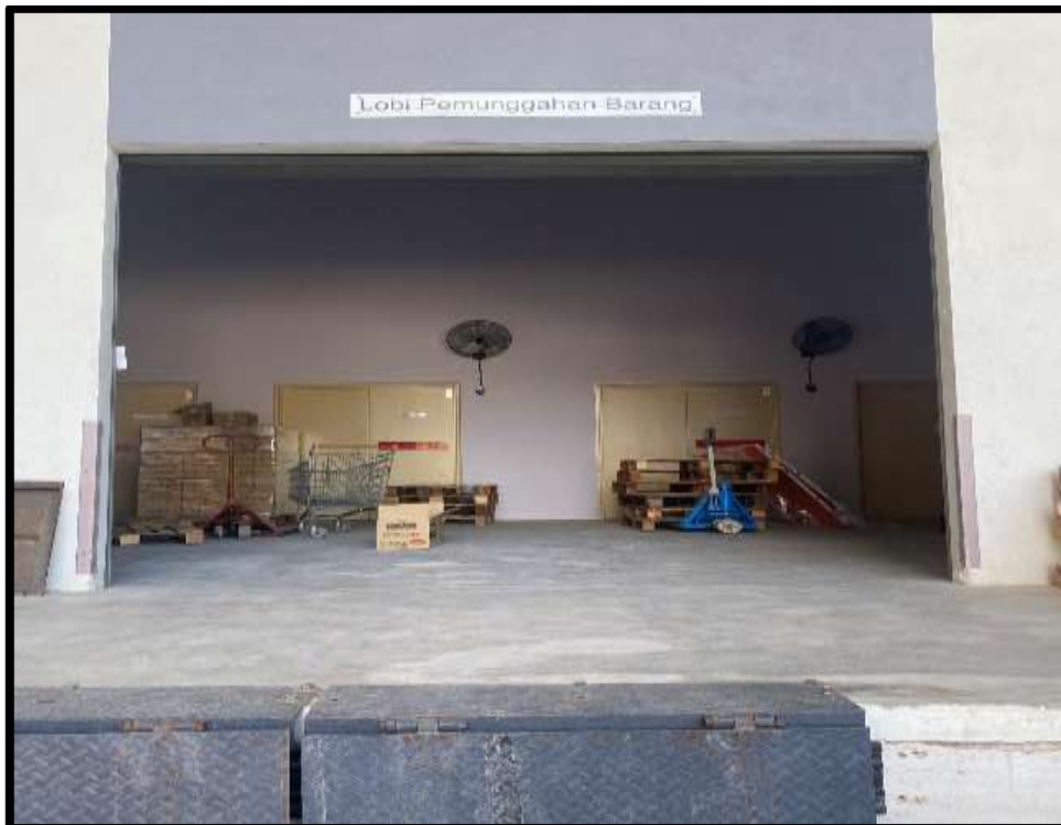
Ruang penerimaan barang