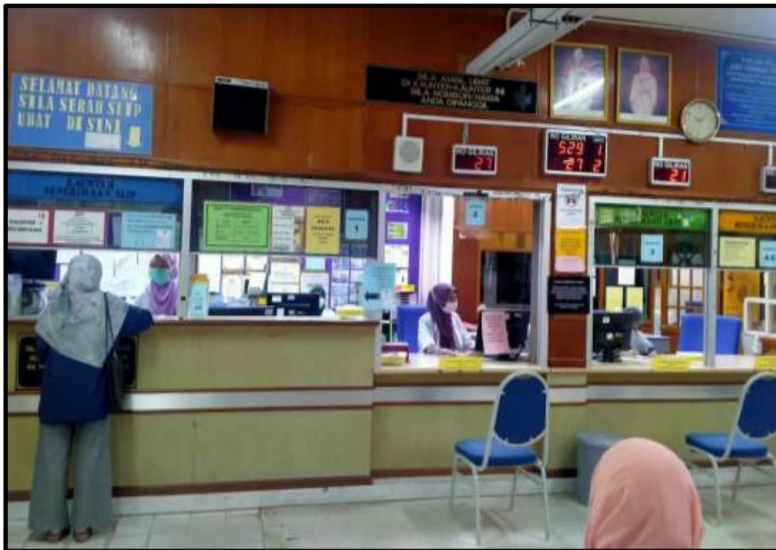
Kaunter Pendispensan Ubat