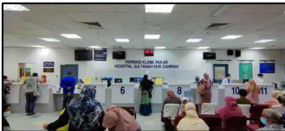
Kaunter Pendispensan Ubat