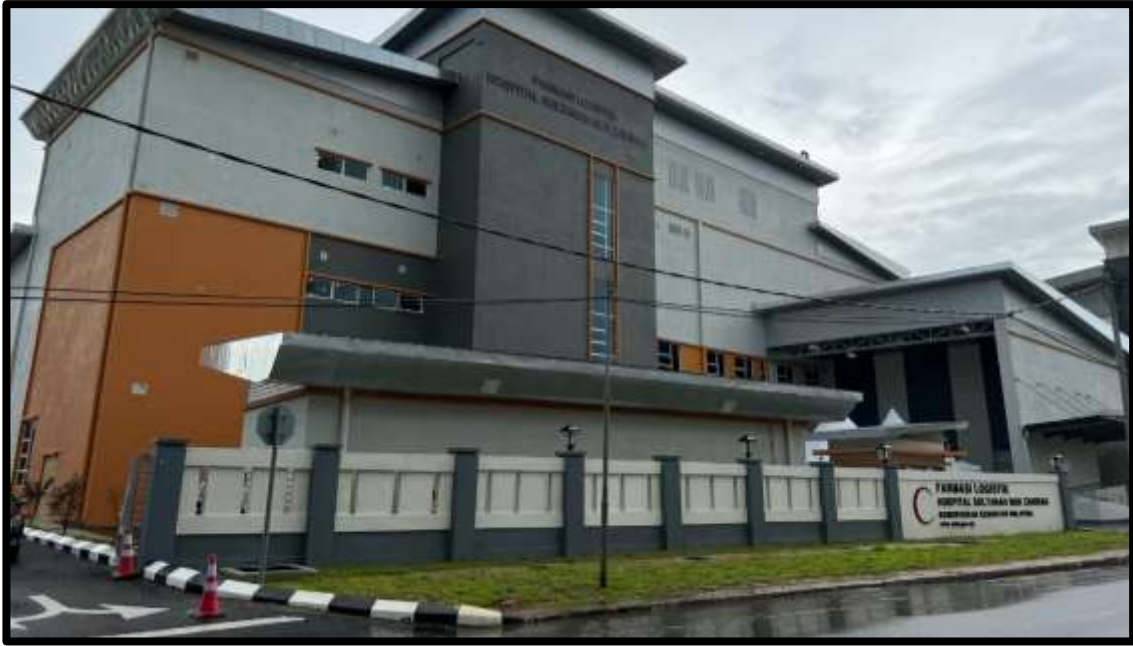
Bangunan Farmasi Logistik