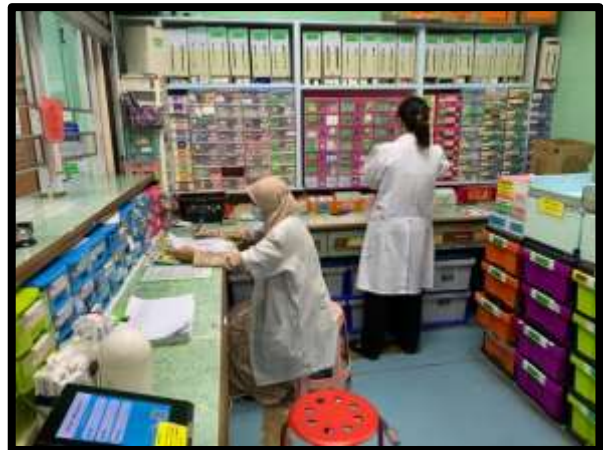
Ruang pengisian ubat