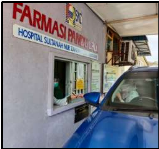
Farmasi Pandu Laluan