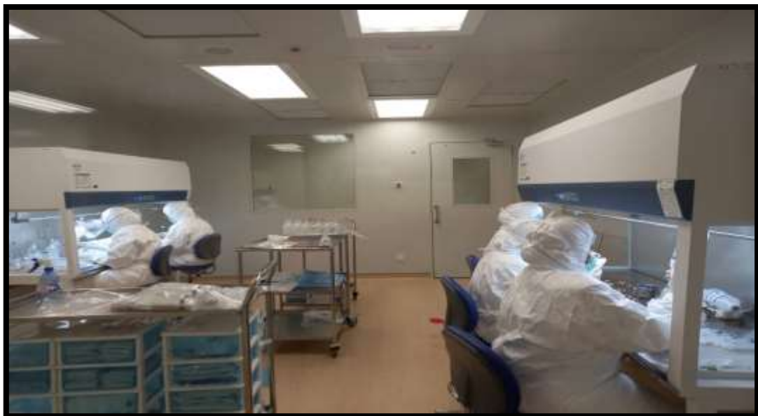
Ruang penyediaan TPN