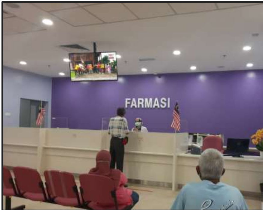
Kaunter Pendispensan Ubat