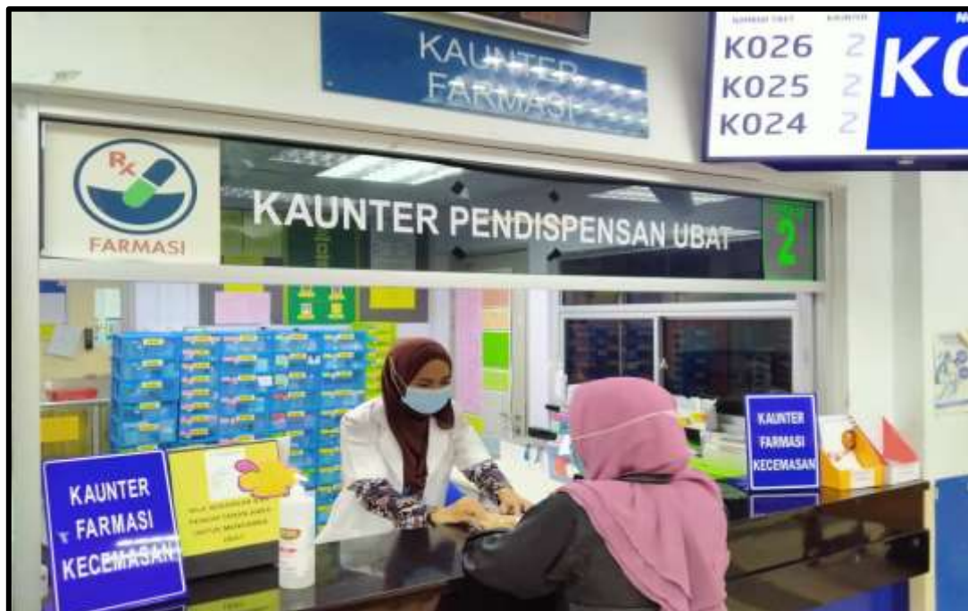
Kaunter pendispensan ubat